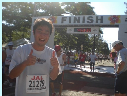
ゴール直後 人生で指折りの達成感を感じた瞬間です

実はこの次の日、海で友人と共に溺れかけるのですが、その話は紙面の都合上、割愛させていただきます・・・