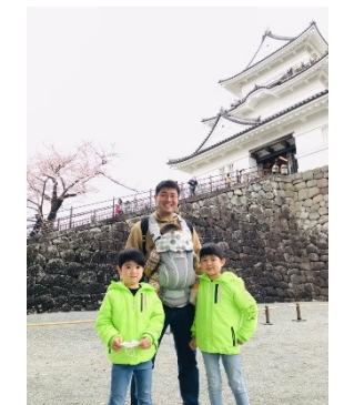
天守閣にも登ってみました。